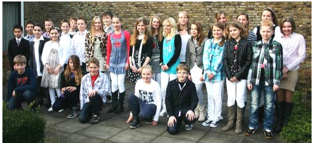
Vormselgroep Ariëns-St. Jan