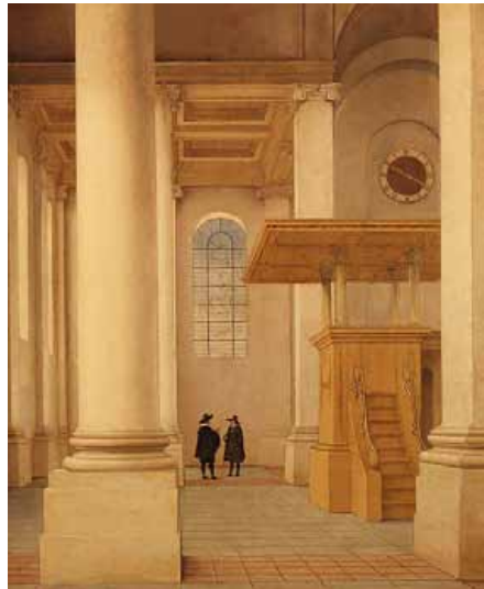
Interieur van de Nieuwe Kerk te Haarlem (1655)