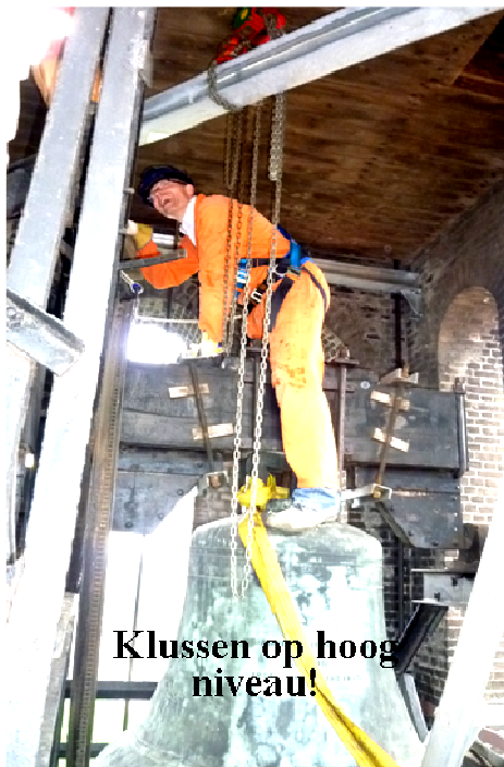
Klussen op hoog niveau!

►De Groot Installatiegroep te Hengelo voor de electrotechnische onderdelen.