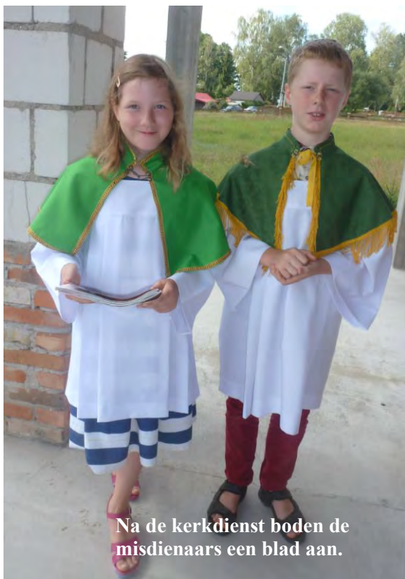
Na de kerkdienst boden de misdienaars een blad aan.