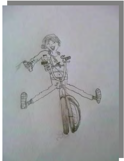
Tekening: Emma Segers

TOEKIJKEN! Ja je staat nu werkelijk te kijken hoe vaak je dit woord kunt gebruiken! 😊