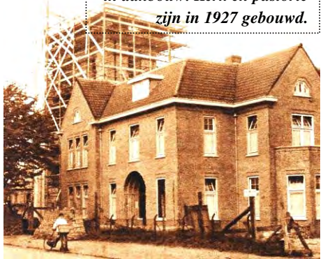
Foto uit 1928, waarop de toren in aanbouw. Kerk en pastorie zijn in 1927 gebouwd.