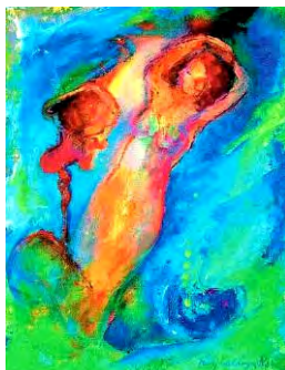
Afbeelding: Marja de Lange