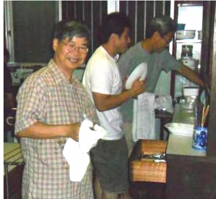
Bij de foto:

daarginds? En als we dan al connecties hebben 'daarginds' dat we die connecties intensiveren?