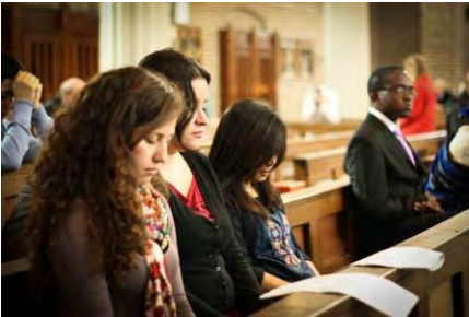
The International Mass brings people together from many different continents.