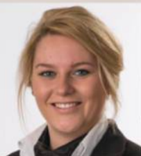
Marlon Noordhuis Uitvaartverzorgers

Wilt u een overlijden melden? Bel dan 0800 8192.