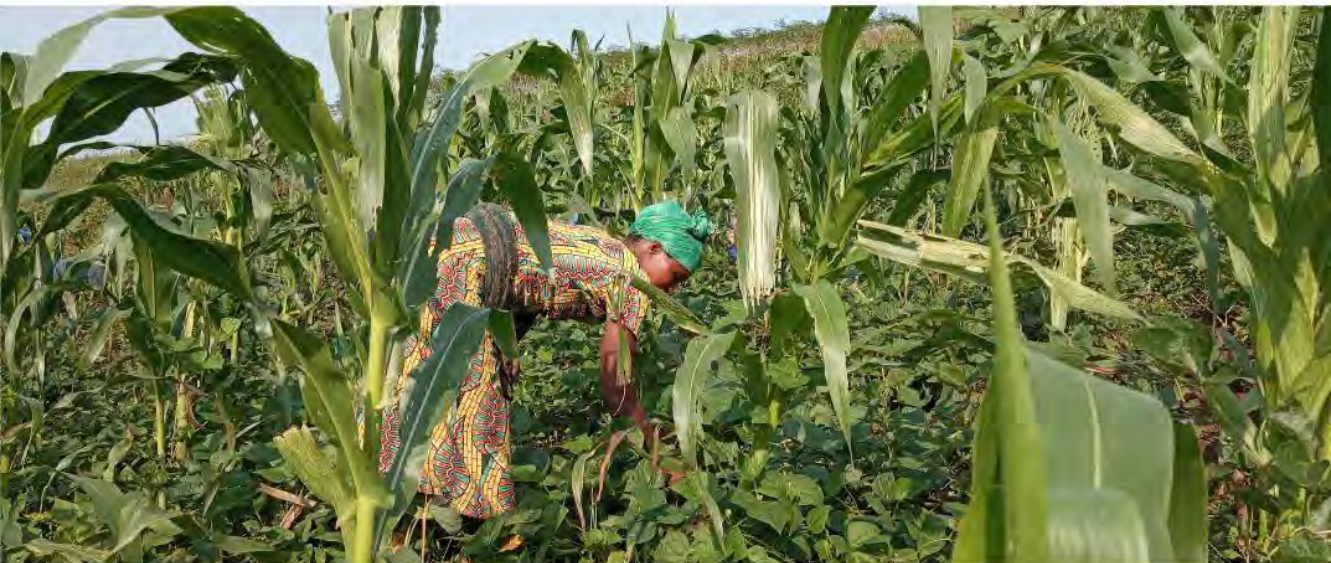
foto: Wieden van mais en bonen in de regio Mweso

In het Masisi gebied verbouwen 50 gezinnen voedsel op gemeenschappelijke akkers. De lokale parochie heeft daarvoor grond beschikbaar gesteld. CAJED weet uit ervaring dat een focus op vrouwen bij landbouwactiviteiten een positief effect heeft op hun kinderen. Daarom krijgen de moeders van elk gezin een startpakket voor eigen gebruik, dat bestaat uit zaden voor aubergine, ui, knoflook, kool, amarant (een zeer voedzaam pseudo-graai) en een schoffel. De opbrengst is bestemd voor extra voeding voor de kinderen, de aankoop van zaden en om voor de kinderen de gezondheidszorg te betalen in het lokale ziekenhuis.