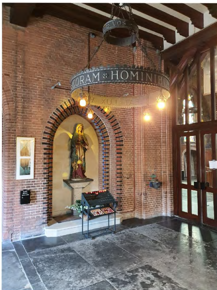
Voorportaal van de Jozefkerk, geopend voor devotie en om een kaarsje op te steken.