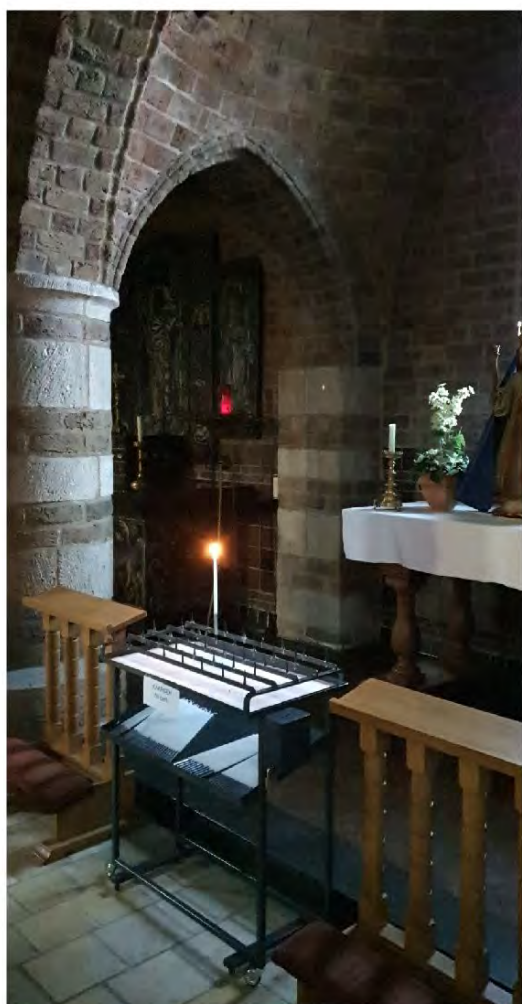
Kaars bij Maria in Jacobuskerk voor iemand die besmet is.

Voorportaal St. Jozefkerk dagelijks 10.00-17.00 uur