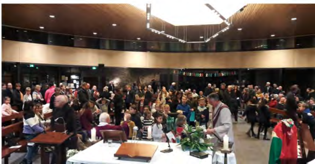
Aswoensdagviering in de St. Jankerk op 26 februari 2020