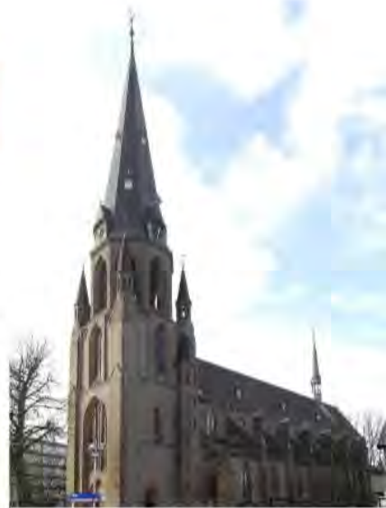
Sint Josephkerk Enschede