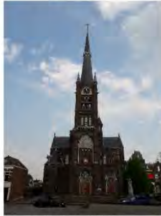
Basiliek St. Liduina