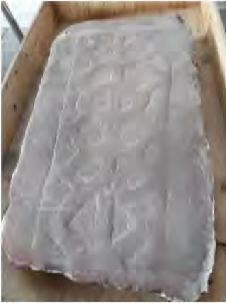
Grafsteen St. Liduina