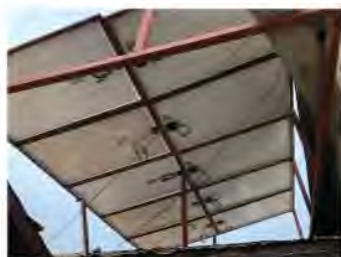
aanleg zonnepanelen in Gambia

Wij kunnen op basis van schattingen nu al zeggen dat wij met zijn allen gewerkt hebben aan een geslaagd project. Het was voor allen, die een steentje hebben bijgedragen, een drukke maar ook inspirerende tijd. Alle medewerkers van de Vastenactie in Utrecht, MOV-ers en de vrijwilligers van de PKN bedankt voor de inspanningen die geleid hebben tot het succes van de actie. Wij hebben erg genoten van het geven van lezingen en het bezoeken van de vele activiteiten die voor het project werden georganiseerd.