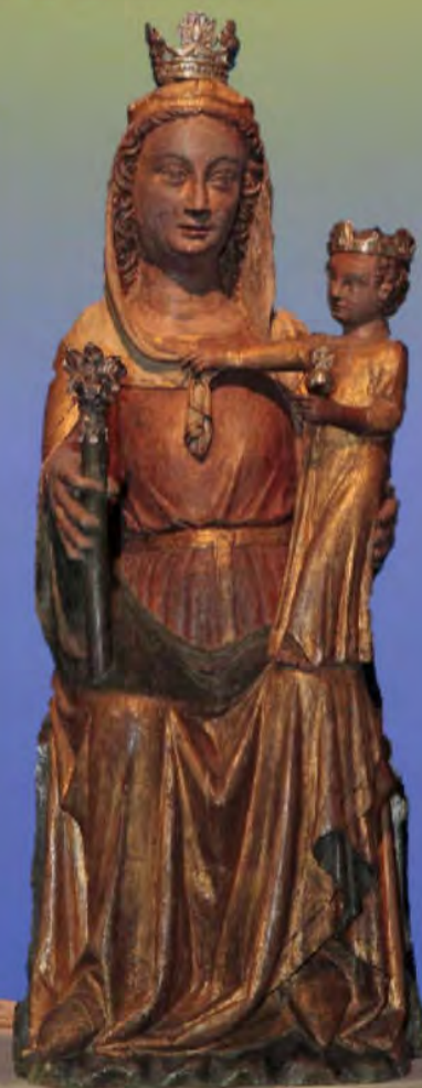
Maria van Renkum ca 1350

Alles over een pelgrimage naar Onze Lieve Vrouw van Renkum