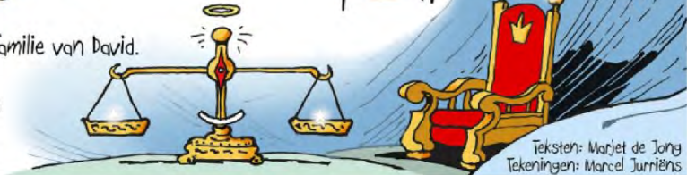
Teksten: Marjet de Jong Tekeningen: Marcel Jurriëns

Dan zal er een koning komen uit de familie van David. Die koning zal eerlijk zijn en trouw. Hij zal regeren als een goede rechter, die het recht kent en rechtvaardig is. (Woorden van de profeet Jesaja 16:5)