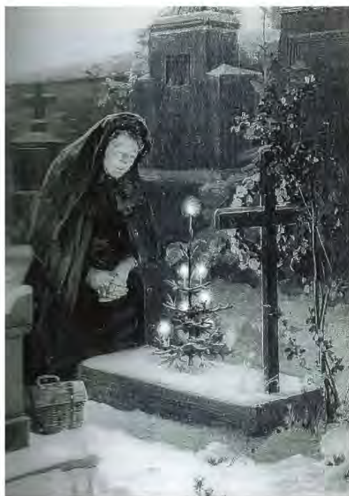
'Weihnachten auf dem Friedhof' door Carl Richtelt (1887)