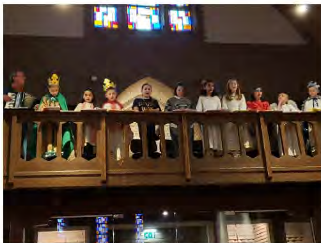
Kinderkoor JM op 6 januari 2019

Het belooft een bijzondere muzikale happening te worden die voor iedereen toegankelijk is. Rond 17.30 uur verplaatst het buitenconcert zich naar binnen in de Jacobuskerk. Wij hopen natuurlijk op veel deelnemers en bezoekers voor deze expeditie, deze zoektocht naar de klanken van 'de Roop' uit de hele wereld. Graag tot dan.