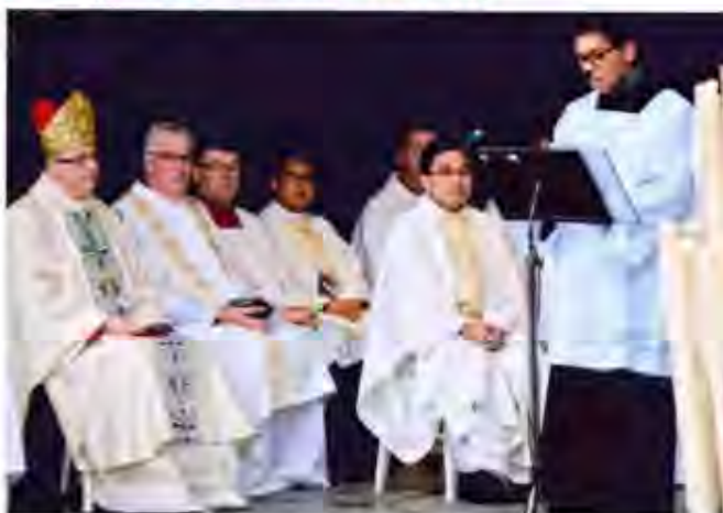
Bij de eerste lezing tijdens een eucharistieviering bij de Grot in Lourdes

Graag wil ik u, zoals ik ook al bij eerdere gelegenheden heb gedaan, vragen om voor mijn medestudenten en voor mij te bidden. Ook zou ik u willen vragen om in uw gebed blijvend te denken aan de toekomst van onze katholieke Kerk en God te vragen