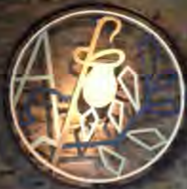
Alfa en Omega aan de muur in de kerk