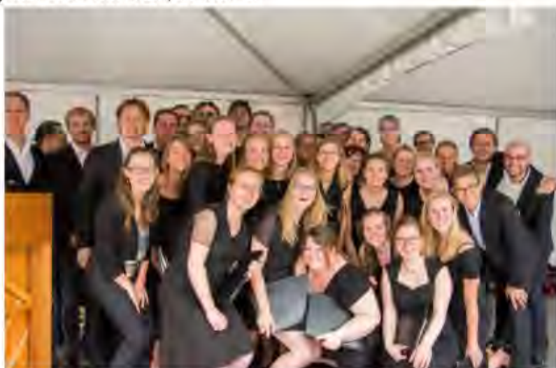
Het Nijmeegs Studentenkoor Alphons Diepenbrock tijdens Nijmegen Klinkt 2017

Zondag 1 juli 2018, St. Jozefkerk (Oldenzaalsestraat 115), Enschede . Aanvang 15:30u. Kerk open 15:00u. Tarief: €10,- (Student/CJP €5,-) Reserveringen: www.nskad.nl