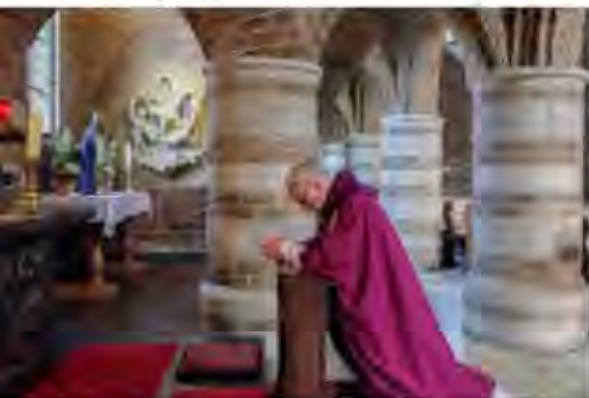
in gebed verzonken

Hij studeerde tot 1994 en werd tot priester gewijd. In 1994 werd hij benoemd in Breukelen waar hij ruim vijf jaar bleef. In die periode viel het begin van de samenwerking met de parochie Maarssen. Rond de eeuwwisseling vertrok hij naar de parochie Ulft-Varsselder-Azewijn. Hij maakte er zijn 12½ jarig priesterjubileum mee maar hij kreeg daar ook darmkanker. Gelukkig sloeg de behandeling aan en hij genas.